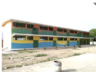
nieuwe vleugel school Fe y Alegria I (la Isabelita S.Vicente Maracay)